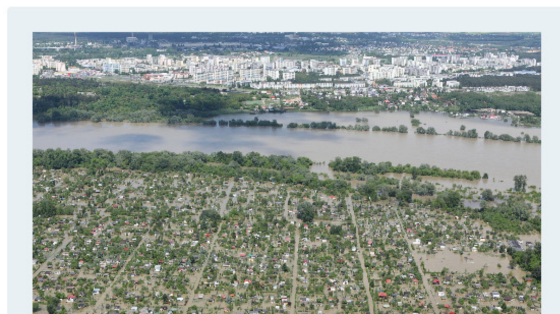
Powódź rzeczna

Obowiązek ten spoczywa na Państwowym Gospodarstwie Wodnym Wody Polskie. W celu wypełnienia zadania, które wynika z Dyrektywy Parlamentu Europejskiego i Rady, Wody Polskie cyklicznie sporządzają przegląd i aktualizację wstępnej oceny ryzyka powodziowego (aWORP). W grudniu tego roku zakończył się ostatni etap tego projektu.